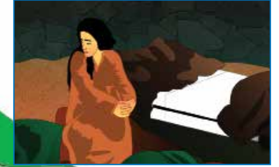
மரியாள் தூதன் சொன்னதைக் குறித்து சிந்திக்கிறாள்