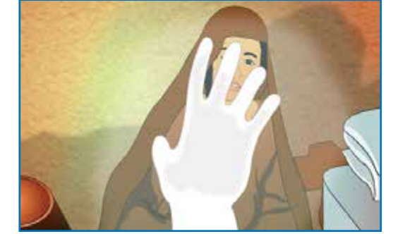
பரிசுத்த குமாரனைப் பற்றி தூதன் மரியாளிடம் கூறுதல்