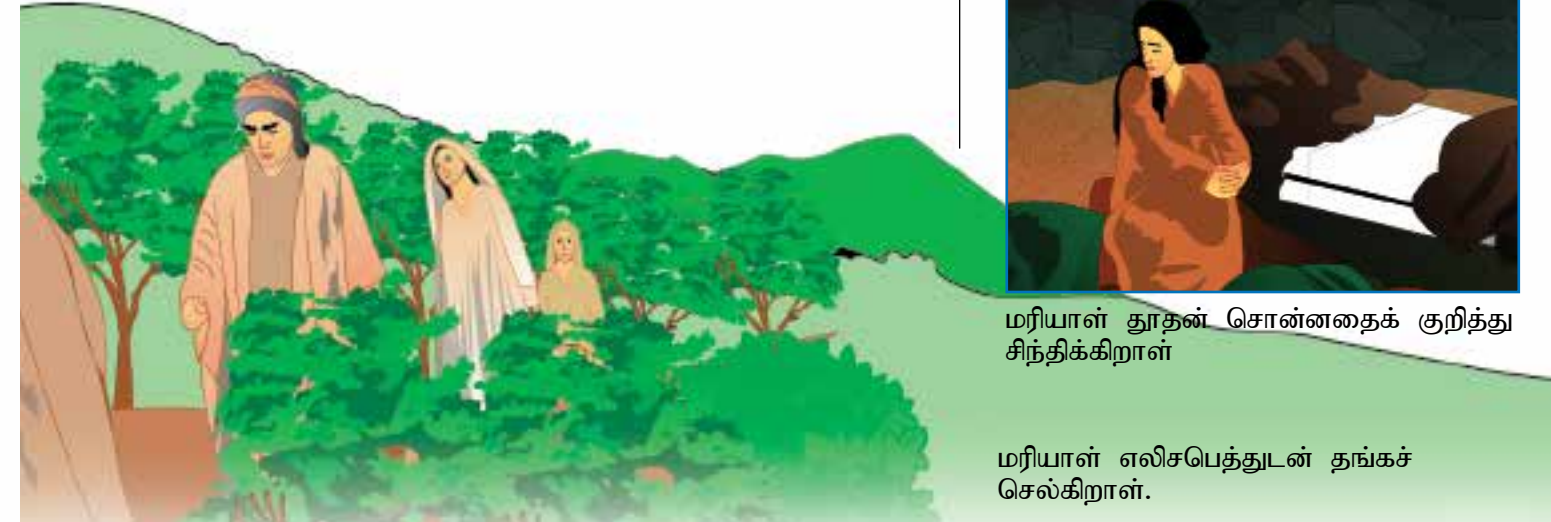
மரியாள் தூதன் சொன்னதைக் குறித்து சிந்திக்கிறாள்

அதற்கு மரியாள் “நான் ஆண்டவனின் அடிமை நீர் சொன்னபடியே ஆகக்கடவது” என்றாள்.