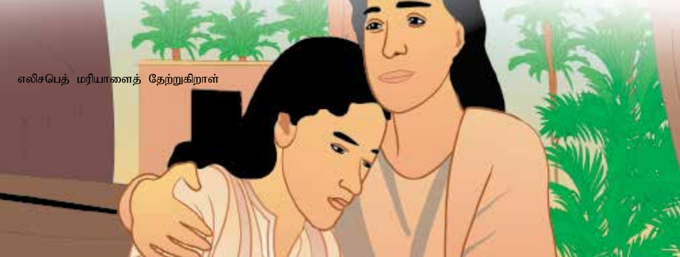
எலிசபெத் மரியாளைத் தேற்றுகிறாள்

“எலிசபெத்தே, ஏன் தேவன் என்னை தெரிந்தெடுத்தார் நான் சாதாரணமானவள்” என மரியாள் வினவினாள். எலிசபெத்து புன்னகைத்து மறு மொழியாக “முதலில் என் குழந்தை பிறகு உன் குழந்தை, தேவன் நமக்குக் காட்டுவார்” என்றாள்.