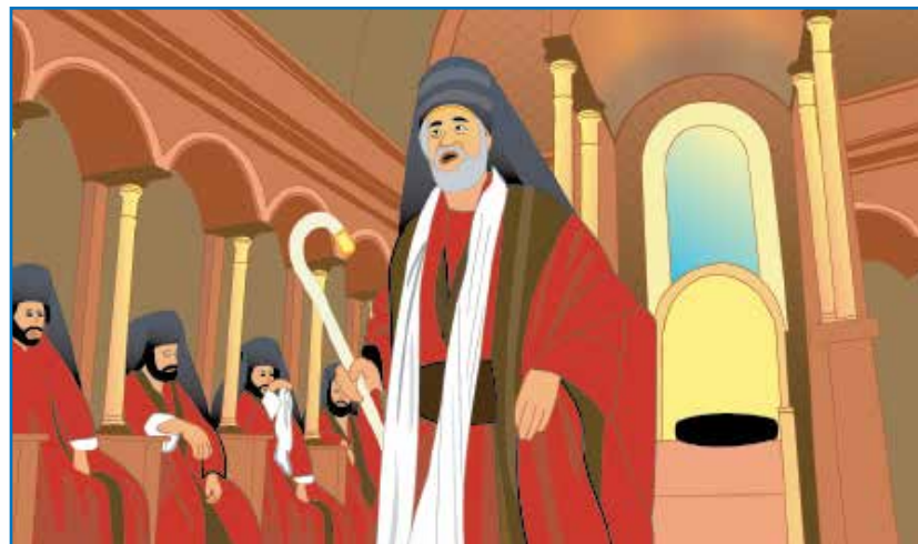
பிரதான ஆசாரியன் காய்பா

கி.பி.18 தொடங்கி 36 வரை காய்பா யூத தலைமை ஆசாரியனாய் இருந்தவன். இவனுக்குமுன் இருந்த ஆசாரியன் அன்னியா என்பவனின் மருமகன். தலைமை ஆசாரியன் பதவி, தன்னுடைய நாட்டில் ஒரு யூதனுக்கு கொடுக்கப்படுகிற ஓர் உயர்ந்த பதவி. இயேசு ஒரு மிரட்டலாய் இருக்கிறார் என்று கருதி அவரைக் கொல்ல திட்டம் போட்டவன்.