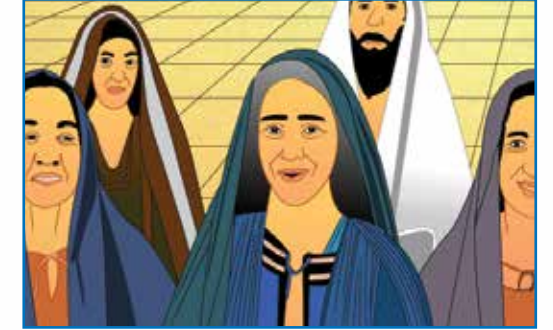
எலிசபெத்து குழந்தை பெறும் வயதை கடந்திருந்தாள்

(லூக்கா 1: 14) உனக்குக் களிப்பும் மகிழ்ச்சியும் உண்டாகும். அவன் பிறப்பின் காரணமாக அநேகர் களிகூருவார்கள். அவன் கர்த்தரின் பார்வையில்