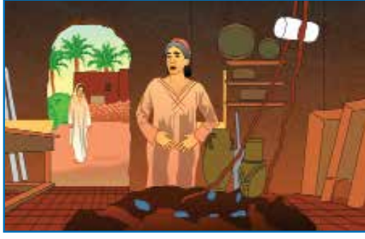
எலிசபெத்தின் பிள்ளை களிப்பில் துள்ளிற்று