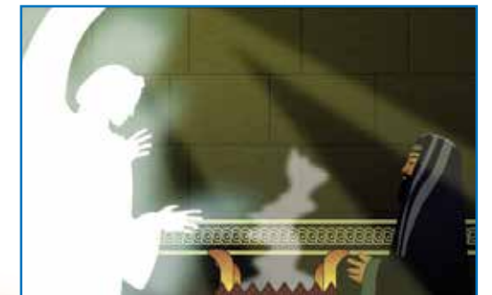
தூதன் காபிரியேல் சகரியாவினிடத்தில் தோன்றுதல்