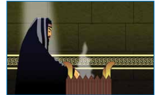
சகரியா தேவாலயத்தில் தூபங்காட்டுதல்