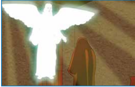
தூதன் மரியாளிடத்தில் தோன்றுதல்

பெரியவனாயிருப்பான். திராட்ச ரசமும் மதுவும் குடியான், தன் தாயின் வயிற்றில் இருக்கும்போதே பரிசுத்த ஆவியினால் நிரப்பப்பட்டிருப்பான். அவன் இஸ்ரவேல் சந்ததியாரில் அநேகரை தேவனாகிய கர்த்தரிடத்திற்குத் திருப்புவான்.