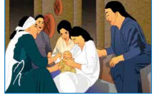
எலிசபெத்து ஒரு மகனைப் பெற்றாள்

இந்தக் கதையைக் கேட்ட ஒவ்வொருவரும், விசேஷமான காரியம் நடைபெற்றதுமல்லால் தேவன் அப்பிள்ளையோடு இருந்தார் என்றனர்.