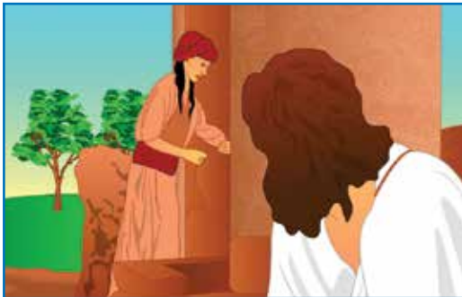
耶稣在井旁向一个撒玛利亚妇人说话