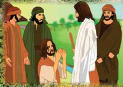
彼得宣认耶稣为——“基督”