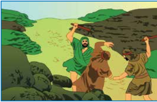
强盗攻击来自耶路撒冷的客旅