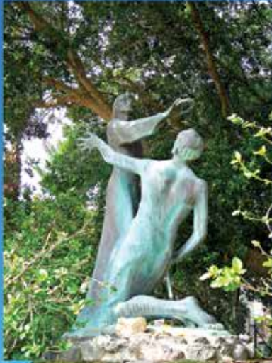
耶稣任命彼得领导加利利初期教会的现代艺术雕像