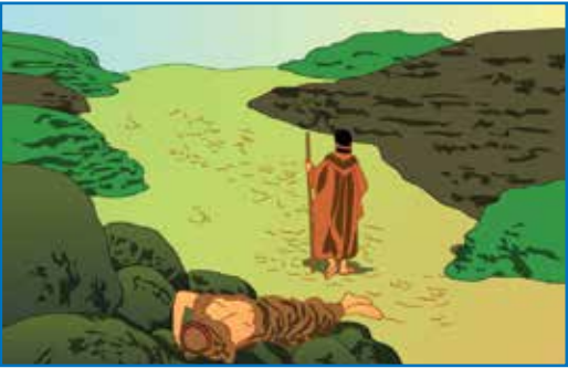
一个祭司看到伤者，却从路的另一边过去了