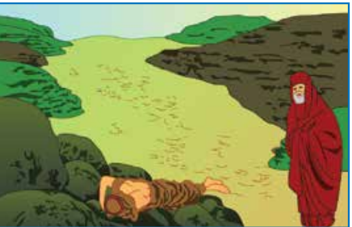
一个利未人也经过

撒玛利亚女人往城里去，将耶稣所说的话都告诉众人。很多人去井边听耶稣说话。听了他的信息后，相信他的人更多了。