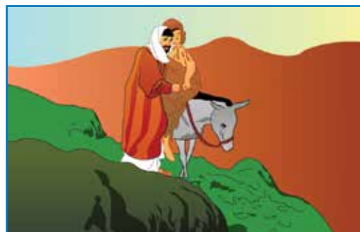
他扶伤者骑上自己的驴子

路10: 36 “你想，这三个人哪一个是落在强盗手中那人的邻舍呢？” 37 他说：“是怜悯他的。”耶稣对他说：“你去，照样做吧！”