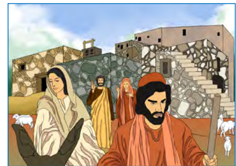
Maria dan Yusuf

Maria menyatakan kasih dan ketaatannya kepada Tuhan. Maria menyambut misi yang diberi kepadanya meskipun ada bahaya yang terlibat. (Rujukan: New Bible Dictionary, 2nd Edition oleh IVP, ms. 746 – 748).