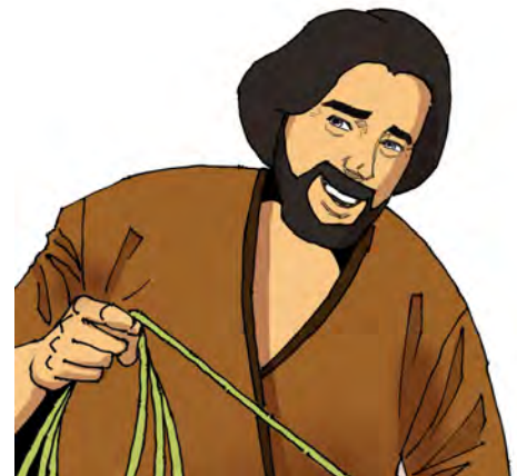
Yakobus, anak Zebedeus

Dia bekerja sebagai nelayan. Dia abang rasul Yohanes. Bapa mereka ialah Zebedeus dan ibu mereka ialah Salome. Tuhan memberi nama julukan 'anak-anak guruh' kepada Yakobus dan saudaranya. Yakobus, adiknya Yohanes dan Petrus menjadi pengikut yang paling rapat dengan Tuhan.