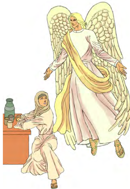
Malaikat muncul kepada Mary.

28 Malaikat itu datang kepada Maria dan berkata, “Salam sejahtera, hai engkau yang sangat diberkati oleh Tuhan! Tuhan menyertai engkau!”