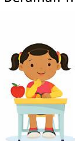
Duduk dengan baik