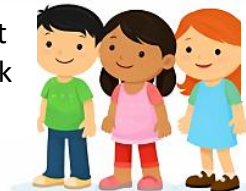
Berbaris dengan senyap