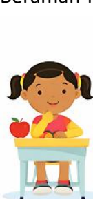
Duduk dengan baik